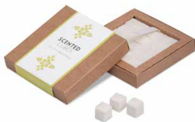
Lily Of The Valley & Freesia