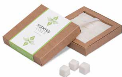
Forest & Moss