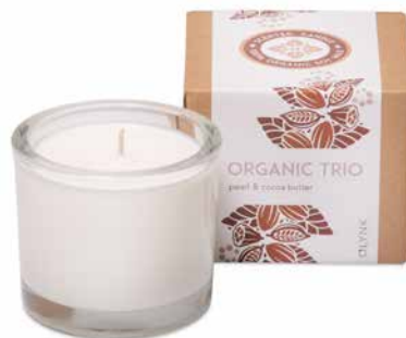
Pearl & Cocoa Butter