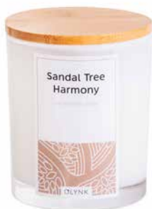
Sandal Tree Harmony