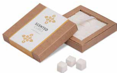
Amber & Apricot