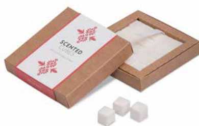
Peony & Poppy Flowers