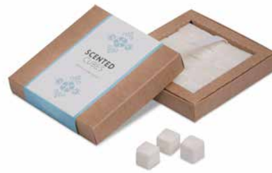
Cotton In The Wind