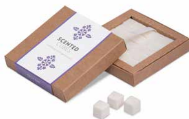
Cornflowers & Forget-me-not