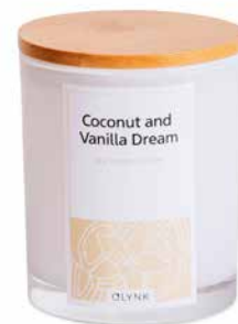
Coconut and Vanilla Dream