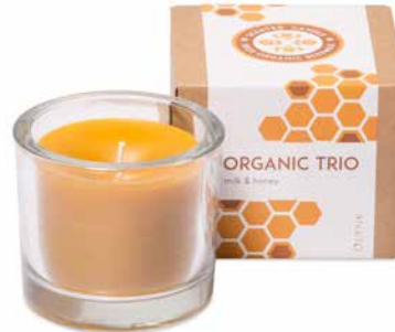
Milk & Honey